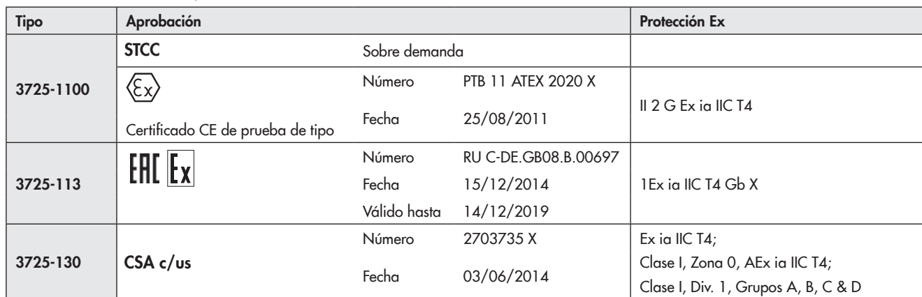
Tabla 2: Resumen de las aprobaciones Ex concedidas

1) Detalles acerca de las aprobaciones Ex ver Tabla 2